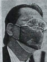
DR NOOR HISHAM

Ujarnya, terdapat 21 kes BID yang mana melibatkan 14 rakyat