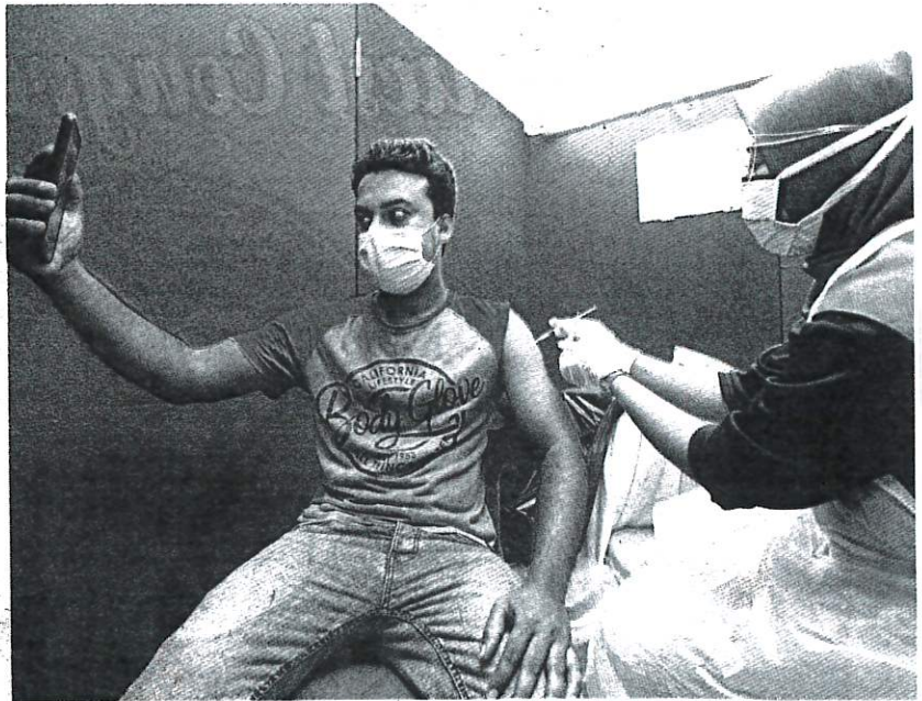
A man taking a selfie as he is vaccinated under the transport and logistics sector in George Town, Penang yesterday.

Dr Noor Hisham also reported that 19,053 people recovered from the virus yesterday, bringing the total to 1,297,723. As of yesterday, 260,700 people are still ill or are being isolated for Covid-19.