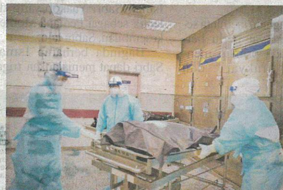
Pengurusan jenazah di hospital sekitar Kuala Lumpur semakin berkurangan.

Sebelum ini, Ketua Pengarah Kesihatan, Tan Sri Dr Noor Hisham Abdullah memaklumkan kemasukan ke hospital dan penggunaan katil unit rawatan rapi (ICU) akibat jangkitan Covid-19 di Lembah Klang kian berkurangan susulan program vaksinasi mencapai tahap 60 peratus.